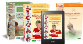
KNIHY A E-KNIHY „Něžná náruč rodičů“, „Rozvíjej se, děťátko“ a „Jak se rodí vodníčci“.