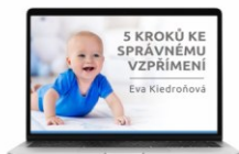
WEBINÁŘ „Kvalitní spánek miminka“